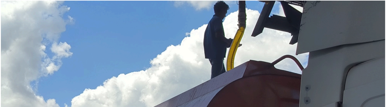
MUATAN CPO · TANGKI PUKAL DI KILANG

Diperoleh dari kilang berlesen MPOB di seluruh Malaysia. Dibekalkan kepada kilang penapisan tempatan atau dihantar sebagai kargo pukal kepada pembeli antarabangsa. Spesifikasi dipersetujui sebelum pemuatan.