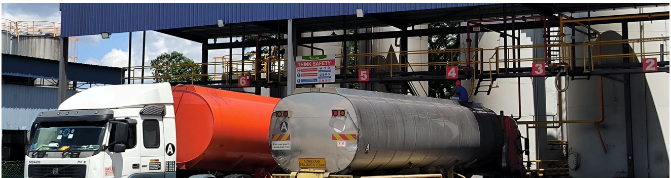
KAWASAN MUATAN · TRAK TANGKI DI KILANG

Kilang penapisan luar negara, pedagang komoditi global, pemproses serantau, pembeli perindustrian.